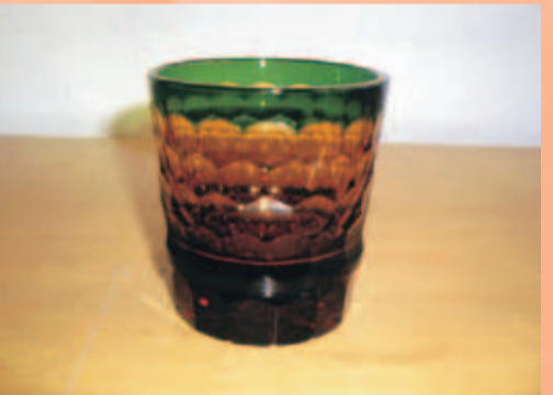
オールド「亀甲」 巾8.7cm×高さ8.8cm この琥珀色の落ち着きが大人の時間を運んでくれます。1つ1つの「亀甲」の削りの技には感嘆します。どこまでも深く、どこまでも静か、その深淵をのぞいた時、新たな思索が思い立つかもしれません。使ってみたい、側に置きたい作品です。

切子の歴史 江戸時代中頃、長崎へ伝わったカットガラス「切子」はまず大阪で作られ、やがて江戸へ伝わって「江戸切子」として花開きました。江戸時代末には薩摩藩が産業振興のため江戸切子の影響を受けながら透明ガラスに色ガラスを重ねて作った生地にカットを施した「薩摩切子」を生み出しました。日本人独特の感性に裏打ちされた薩摩切子は高い技術と美しさを誇りましたが、幕末の動乱の中、短命の内に廃絶してしまっただけです。滅びた薩摩切子は百数十年以上長らく忘れ去られていましたが、20世紀末に再び見直され、その美しい姿を蘇らせたのです。