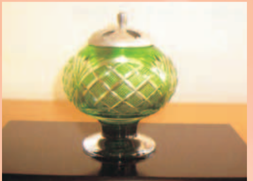
香炉 巾10cm×高さ13.3cm 健やかで、清々しい作品です。そこにあるだけで、さわやかな風が吹いてくるような気がします。光をあつめ、風を呼び、その香炉の作品はただそこに静かにたたずんでような風情が見られます。