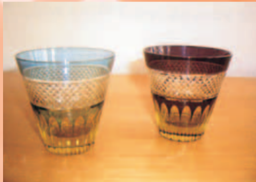
天開ロック「あられ」 巾8.7cm×高さ8.7cm なつかしさと新しさとが入り交じったカットは圧巻です。ソーダガラスを使用しています。使うごとにその輝きに魅了されそうです。まるで、ぬくもりのある、心あたかくなる「あられ」が手中におさまるかのようです。