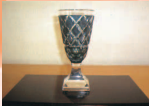
脚付杯「薩摩復刻」 口径7.2cm×高さ16.2cm ただそこにあるだけで、時代を越えて来た物語を語ってくれるような気がします。「薩摩復刻」薩摩ブルーの堂々たる威風を現代に放っている。ゆったりと楽しむ杯、全体の削りの技にはため息が出ます。