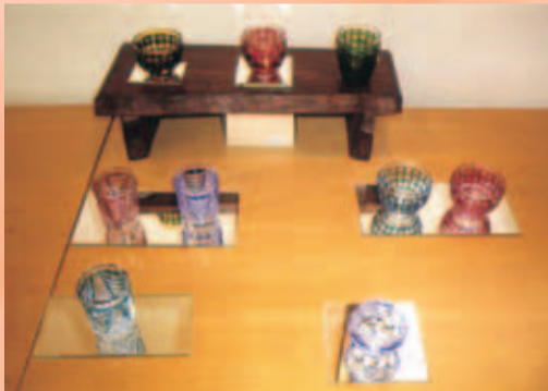
盃 各種 右はしの「あじろ」金赤 巾6.6cm×高さ5.0cm 掌の玉のような作品です。どのようなお酒でもおいしくいただけるのは間違いありません。今年のお祝い、プレゼントにも喜ばれるかと思えます。小さな作品ですが、カットの技が光ります。

ご挨拶 作品展によせて カットマシンに向かい、全神経を手元に集中する。全てを忘れ、切子ガラスの作品作りで没頭する。作家として、五十五年間切子硝子一筋に研鑽を積んで来ましたが、私は、「たくみ工房」切子ガラスの工芸研究所も主宰しております。後に続く人達にも、その技を伝えたいと励んでおります。また、伝統ある薩摩切子を蘇らせた技、培ってきた技術を駆使して、切子の未来への潮流を生み出そうという思いもあります。自分しか出来ないこと、自分らしく出来ることを常に考えて仕事に向かっています。特に「あじろ」「シリーズ」「ほたる」「シリーズ」「モザイク」シリーズは私らしい仕事といえ、他の方の追随を許さないところの仕事とも言えます。江戸切子でもなく薩摩切子でもなく、今までなかった切子の世界を伝統の技を大切にしつつ、開拓しております。私の主宰する「たくみ工房」では、薬品でガラスの表面を溶かして磨く「酸磨き」ではなく、「手磨き」にこだわっています。手間はかかるのですが、鋭いエッジが産まれ、そのカットのシャープさがまるで違うのです。そういったことも含めて、どうぞ私の作品を間近に見ていただきたく思います。一人でも多くの北海道、札幌の方々にご高覧いただけることを願っています。 (切子硝子作家・高橋太久美)