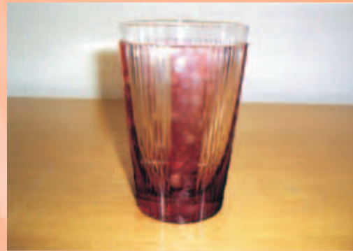
タンブラー「ほたる」 巾7.5cm×高さ11.3cm この金赤の色の深さには目を見張ります。美しい空気、水の輝きを写しとったような作品です。その輝きは高級クリスタル24%を使用ということもあります。ほたるがもつ光を作品の中に。その高度な技が戒せるものとしてガラスの光は自由に遊んでいるかのようです。